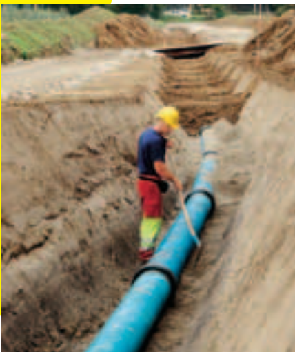
8 Scarpare con pendenza corretta.