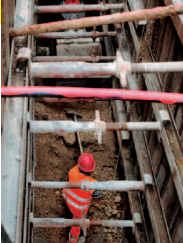
5 Dimensionare correttamente puntelli e sbadacchi.