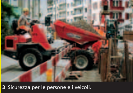
3 Sicurezza per le persone e i veicoli.