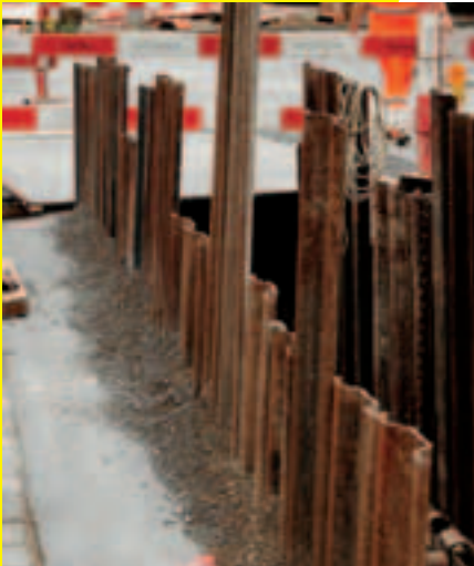
4 Nessuna caduta di materiale nello scavo.