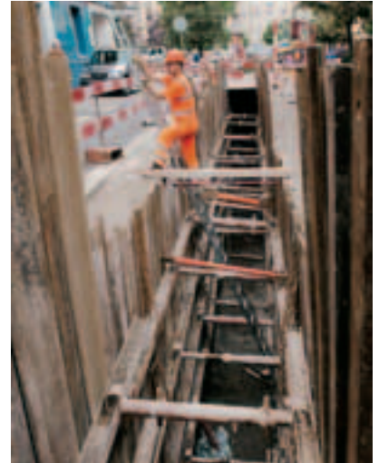
6 Accessi sicuri.