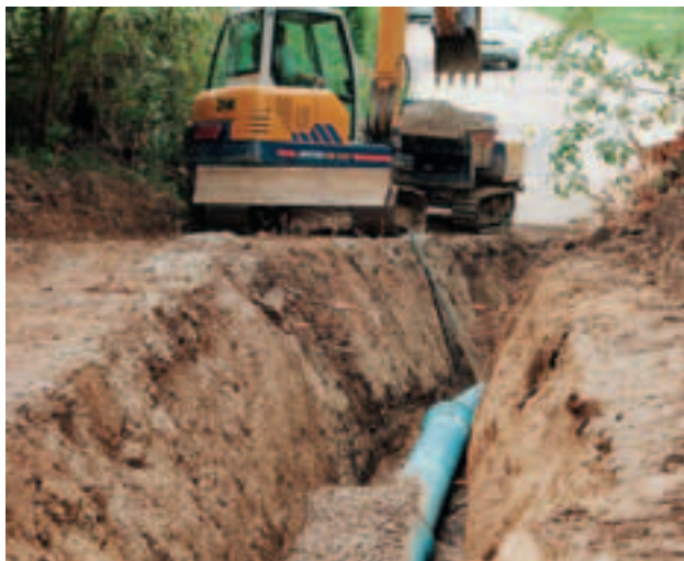
9 Scarpare o sbadacchiature obbligatorie a partire da 1,5 m.