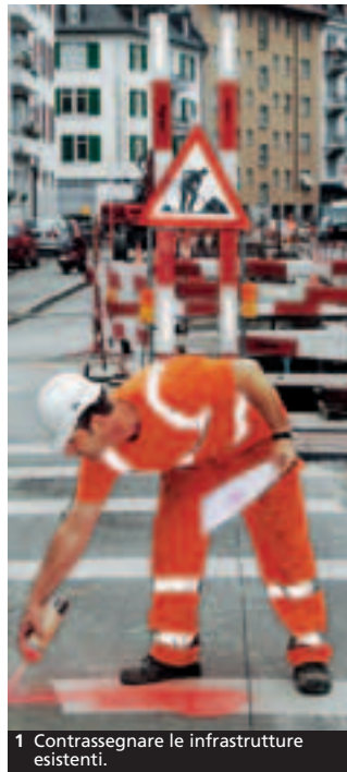
1 Contrassegnare le infrastrutture esistenti.

SBV Schweizerischer Baumeisterverband SSE Société Suisse des Entrepreneurs SSIC Società Svizzera degli Impresari-Costruttori Societat Svizra dals Impresaris-Constructurs