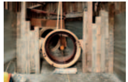
7 Larghezza dello scavo dimensionata correttamente.