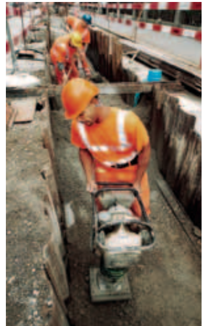
2 Sicurezza delle persone durante il riempimento.