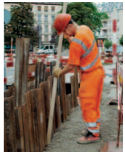
10 Riempire gli spazi vuoti dietro le pareti di sostegno.