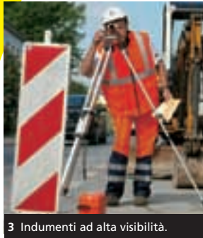
3 Indumenti ad alta visibilità.