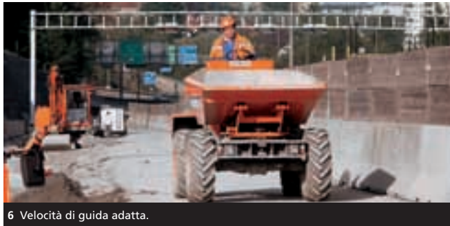
6 Velocità di guida adatta.