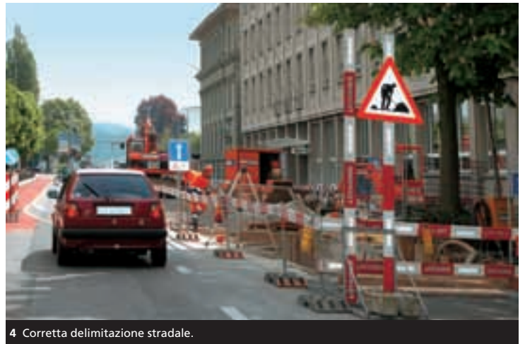
4 Corretta delimitazione stradale.