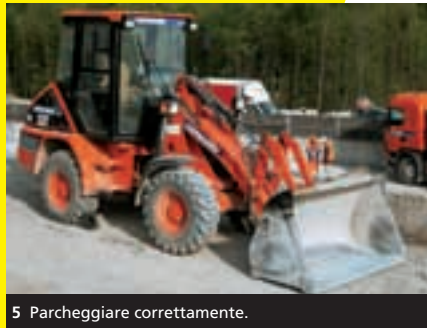
5 Parcheggiare correttamente.