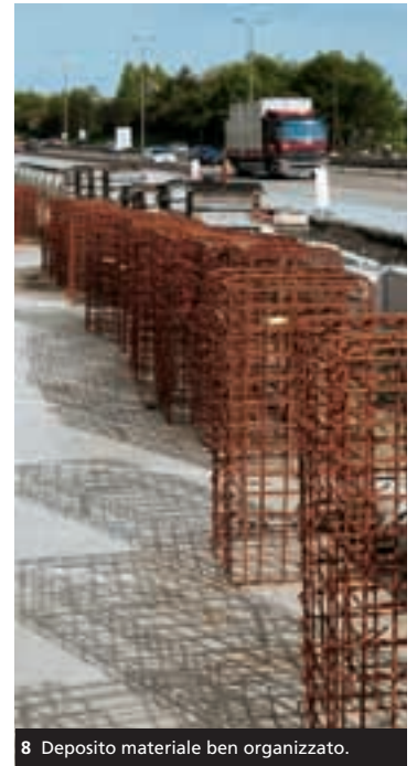
8 Deposito materiale ben organizzato.