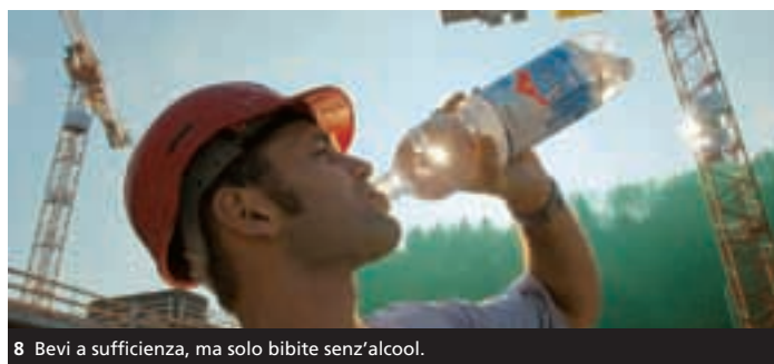
8 Bevi a sufficienza, ma solo bibite senz'alcool.