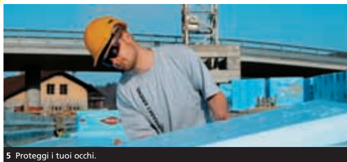
5 Proteggi i tuoi occhi.