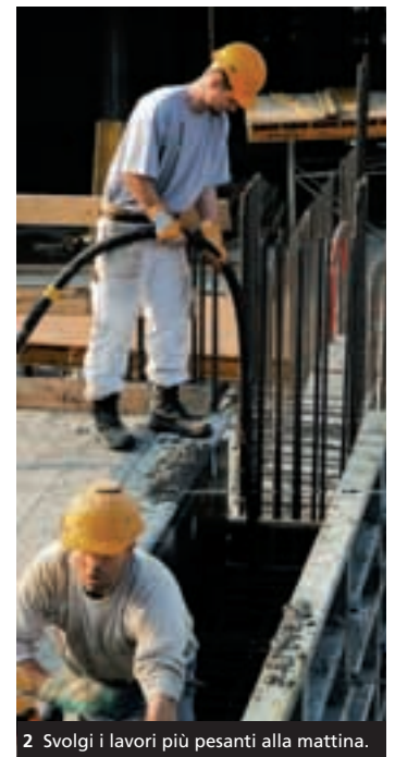
2 Svolgi i lavori più pesanti alla mattina.