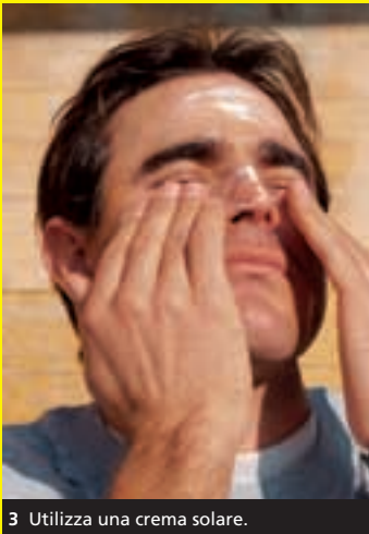
3 Utilizza una crema solare.