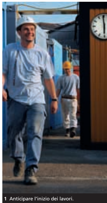
1 Anticipare l'inizio dei lavori.

SBV Schweizerischer Baumeisterverband SSE Société Suisse des Entrepreneurs SSIC Società Svizzera degli Impresari-Costruttori Societad Svizra dals Impresaris-Constructurs