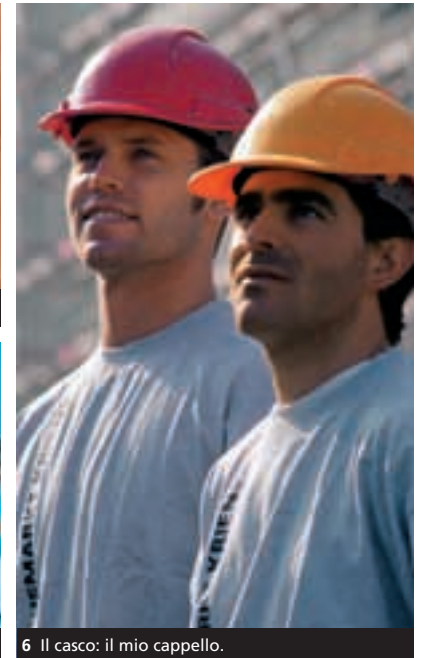
6 Il casco: il mio cappello.