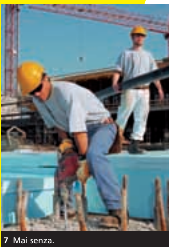
7 Mai senza.