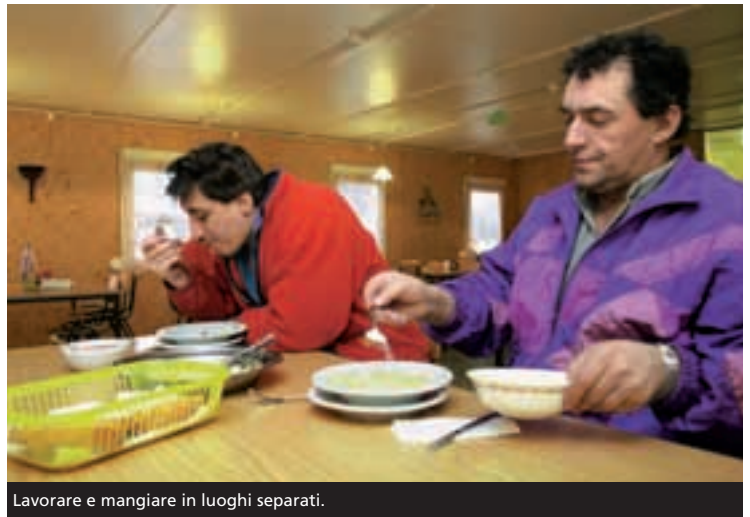
Lavorare e mangiare in luoghi separati.