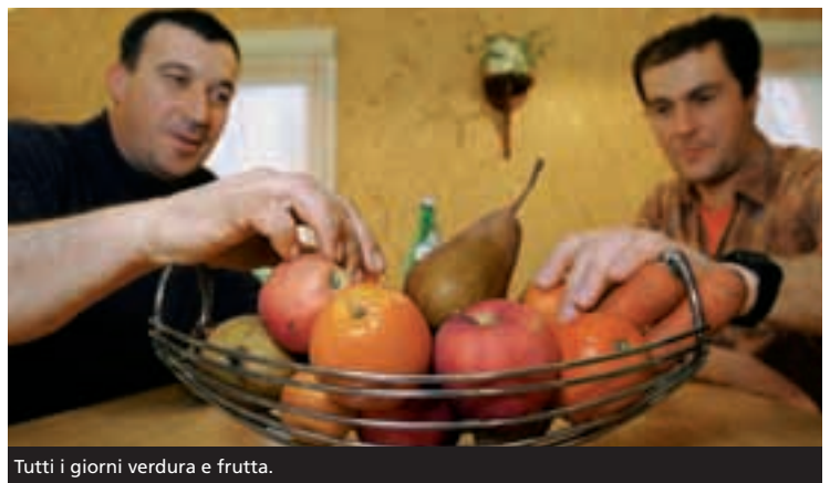
Tutti i giorni verdura e frutta.