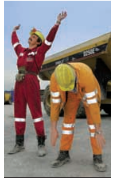
Fare esercizi di rilassamento dei muscoli.