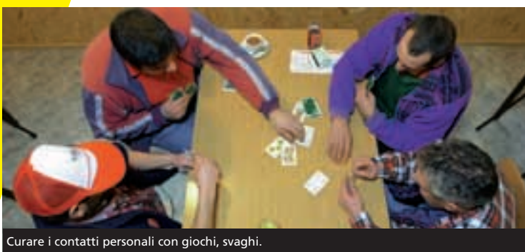
Curare i contatti personali con giochi, svaghi.