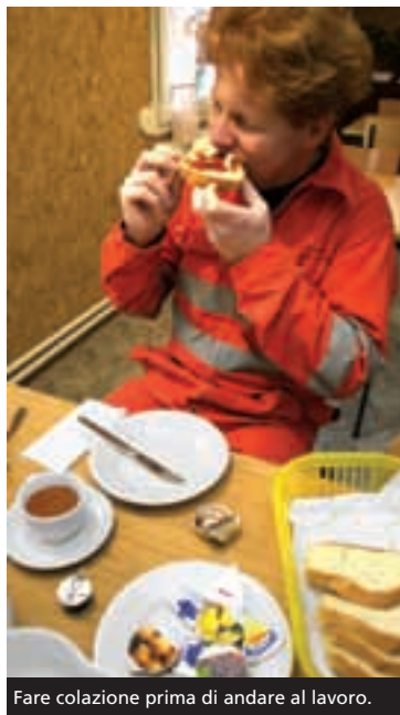
Fare colazione prima di andare al lavoro.