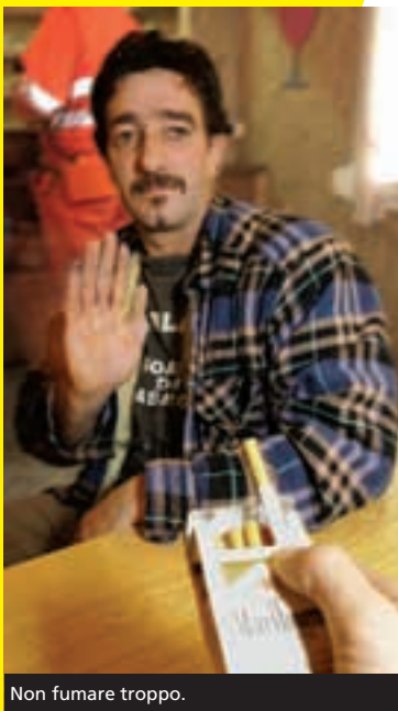
Non fumare troppo.