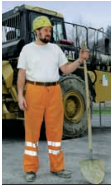
Indossare sempre una maglietta (T-Shirt).

SBV Schweizerischer Baumeisterverband SSE Société Suisse des Entrepreneurs SSIC Società Svizzera degli Impresari-Costruttori Societat Svizra dals Impresaris-Constructurs