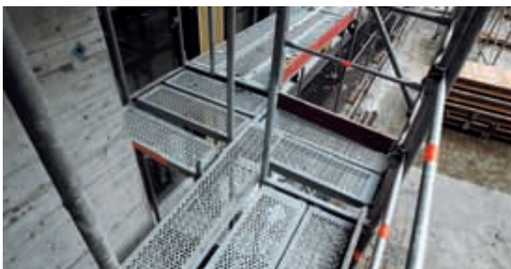
10 Ponteggi collegati in modo continuo.