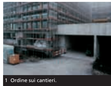
1 Ordine sui cantieri.