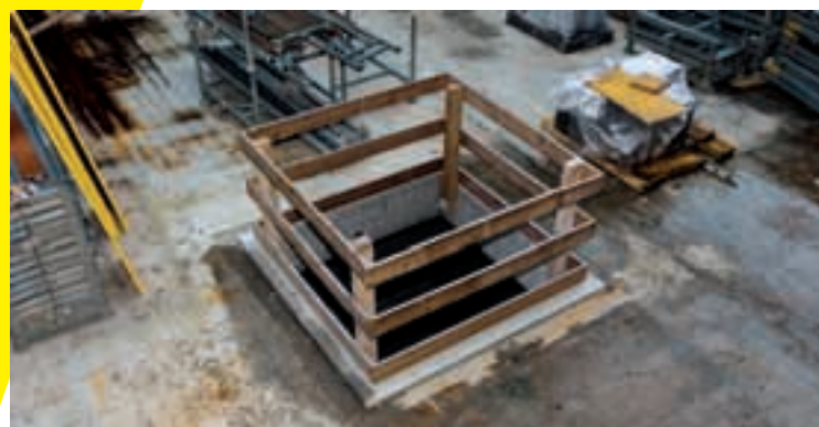
9 Apertura protetta con parapetti.