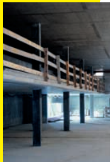
5 Parapetti continui.