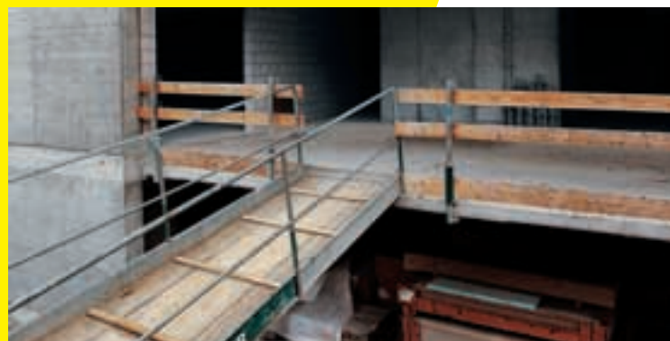
3 Accesso resistente e sicuro.