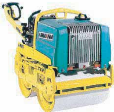
ROULEAUX COMPRESSEUR INF. A 2 T.