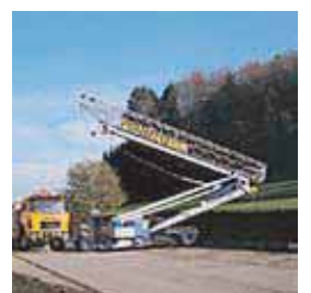
GRUE A MONTAGE RAPIDE AVEC ROTATION A LA BASE ET FLECHE HORIZONTALE