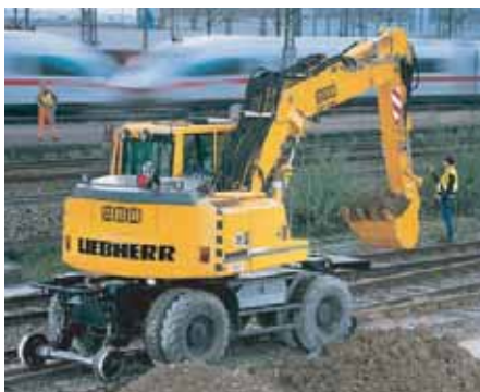
PELLE RAIL - ROUTE (plus formation CFF)