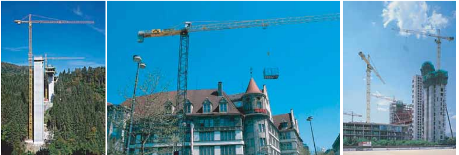
GRUES A TOUR AVEC ROTATION EN TETE DE MAT ET FLECHE HORIZONTALE