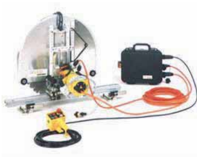
OUTIL DE SCIAGE ET CARROTTAGE