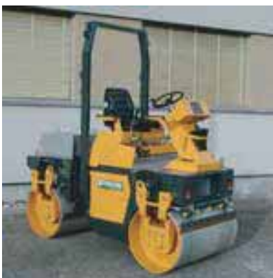
ROULEAUX COMPRESSEUR INF. A 5 T.