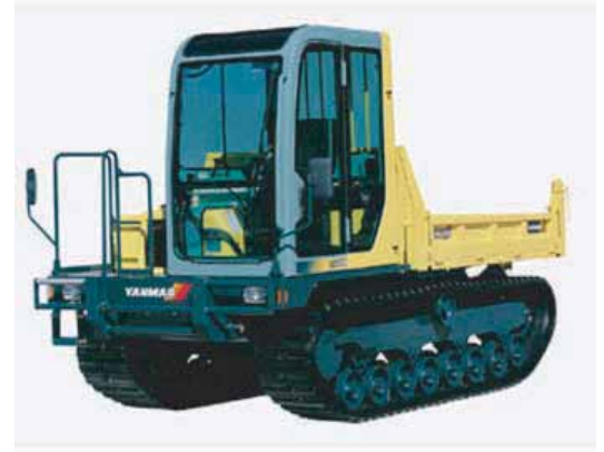
CARRIER - CHENILLARD