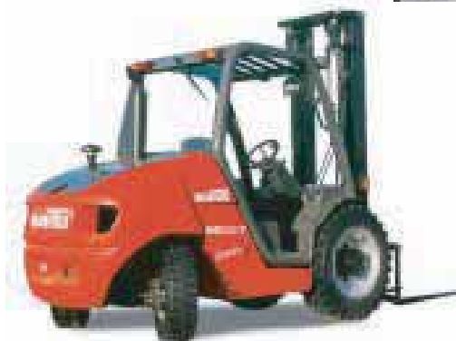
PERMIS DE CARISTE OBLIGATOIRE