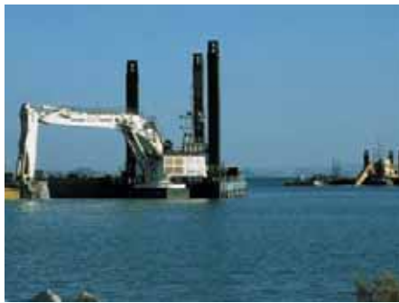
PELLE SUR PONTON