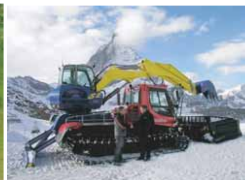
ENGIN SPECIALISE FAUCHEUSE DE TALUS NETT. DE COURS D'EAU