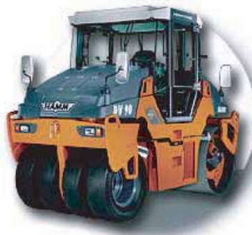
ROULEAUX TANDEM MIXTE A VIBRATION