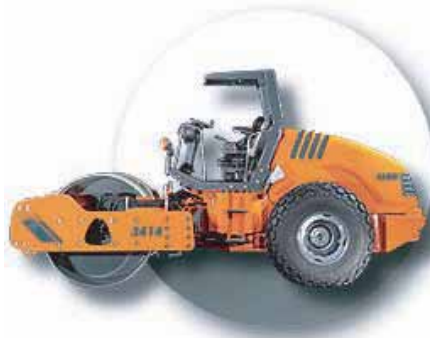
COMPACTEUR AVEC BILLE LISSE