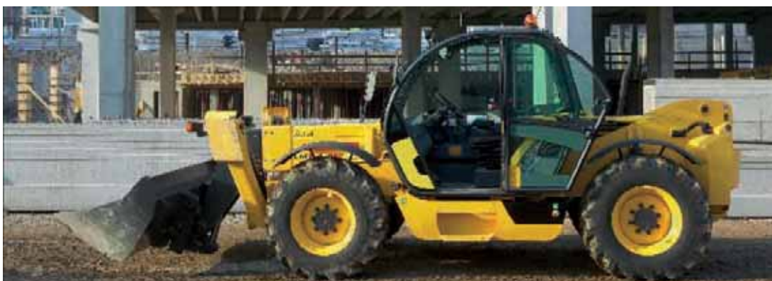
CHARGEUSE SUR PNEUS MULTIFONCTION ( EN CAS D'UTILISATION AVEC DES FOURCHES LE PERMIS CHARIOT ELEVATEUR EST NECESSAIRE EN COMPLEMENT DU PERMIS M3, EN CAS D'UTILISATION COMME GRUE AVEC SYSTEME DE TREUILAGE, LE PERMIS K1 EST NECESSAIRE EN COMPLEMENT DU PERMIS M3)