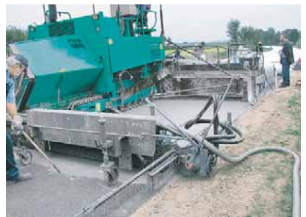
FINISSEUSES A BETON - RADIER - ROUTES