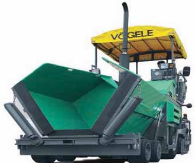
FINISSEUSE A PNEUS