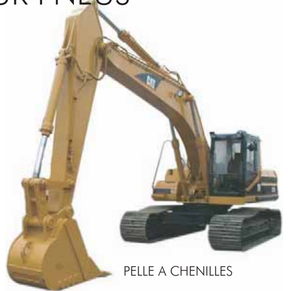
PELLE A CHENILLES