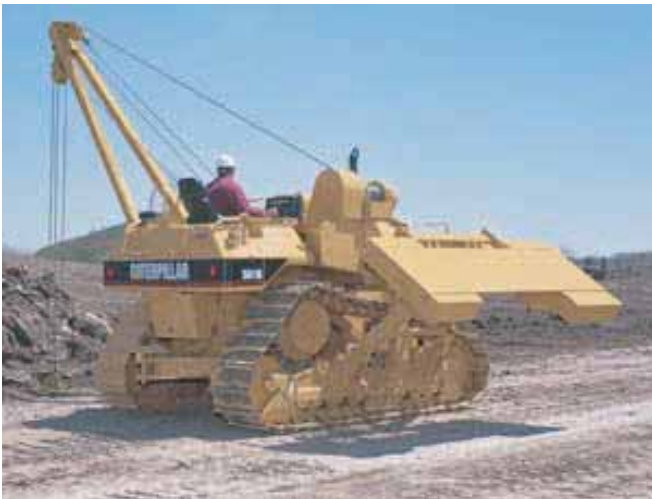
ENGINS POUR POSE DE CANALISATIONS