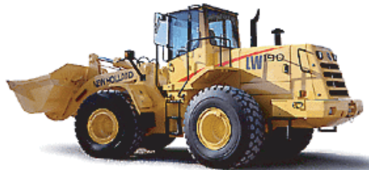
CHARGEUSE SUR PNEUS