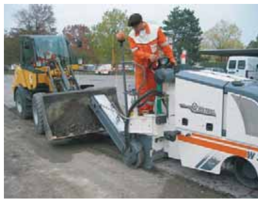
FRAISEUSE A FROID AVEC CONVOYEUR