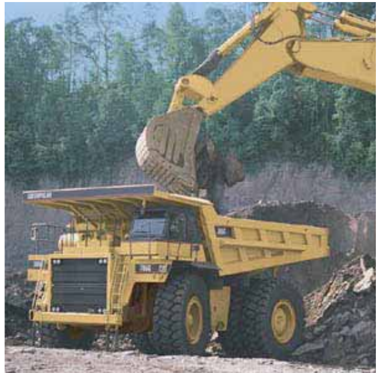
TOMBEREAU / GRAND DUMPER SUR CHANTIER