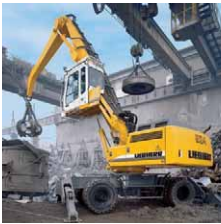
PELLE DE MANUTENTION