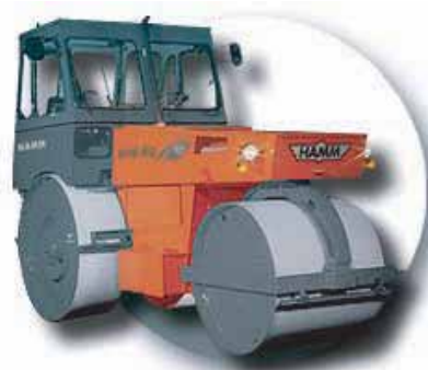
ROULEAUX STATIQUES TRICYCLES