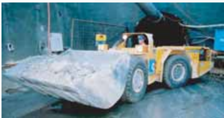
CHARGEUSE TRAVAUX SOUS TERRE