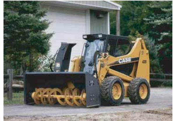
CHARGEUSE COMPACTE AVEC DIVERS EQUIPEMENTS DE TRAVAIL