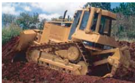
BOUTEURS / BULLDOZER )