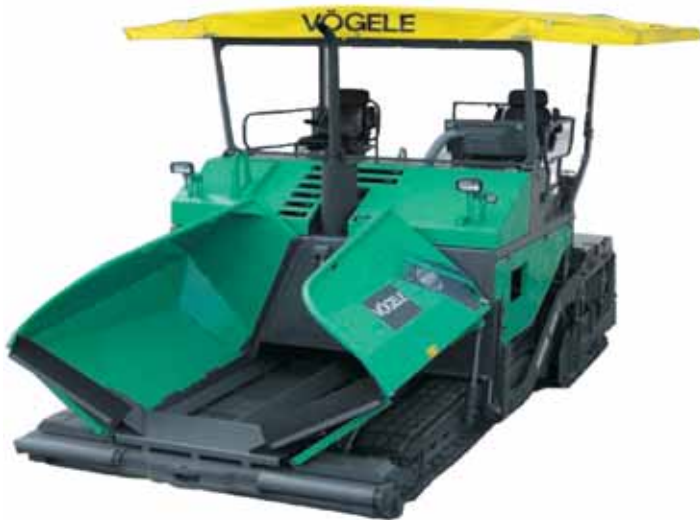
FINISSEUSE A CHENILLES