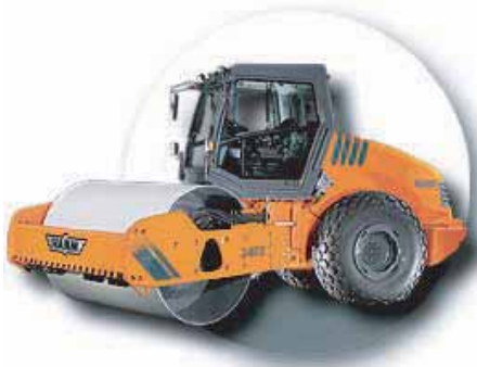
COMPACTEURS AVEC OSCILLATION ET VIBRATION