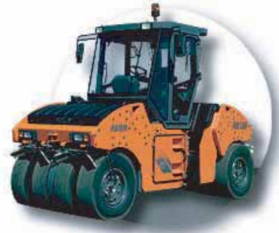
COMPACTEURS A PNEUS