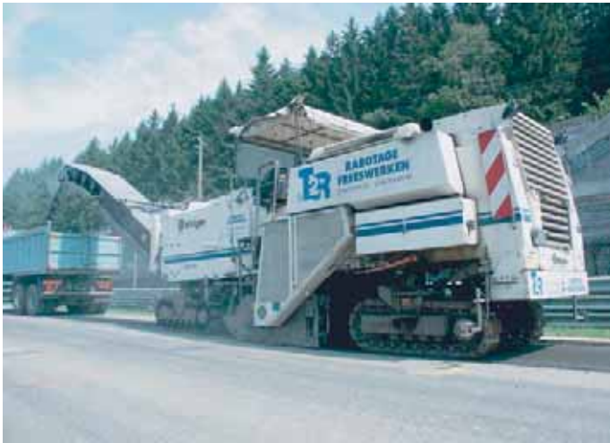
RABOTEUSE D'ENROBE A FROID