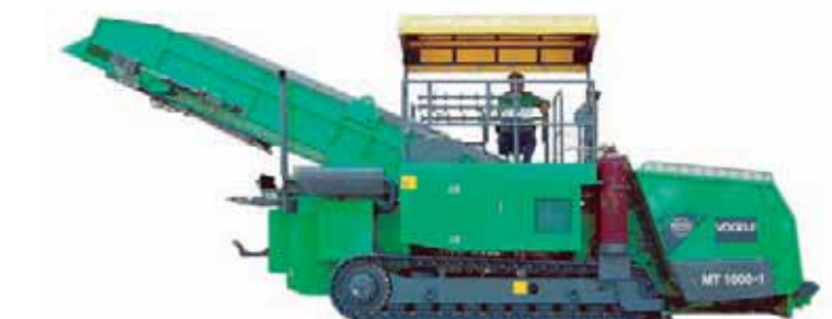
ENGIN D'ALIMENTATION POUR FINISSEUSE