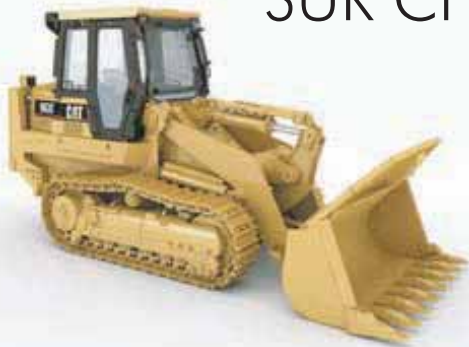
CHARGEUSE SUR CHENILLES

CHARGEUSE DES 5 TONNES SUR CHENILLES OU SUR PNEUS