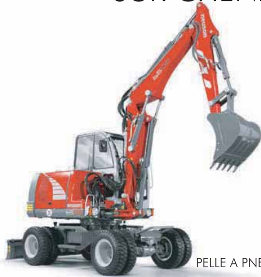
PELLE A PNEUS