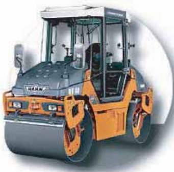
ROULEAUX TANDEM A DOUBLE VIBRATION