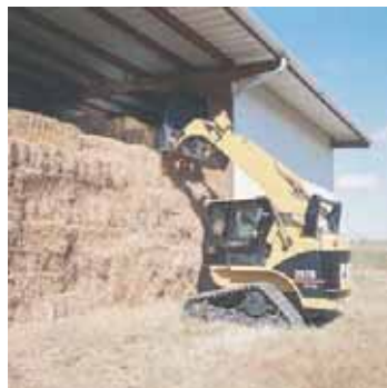
CHARGEUSE MULTIFONCTION ( PERMIS DE CHARIOT ELEVATEUR OBLIGATOIRE EN UTILISATION DES FOURCHES)