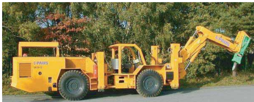
ENGINS SPECIAUX POUR TRAVAUX EN TUNNELS