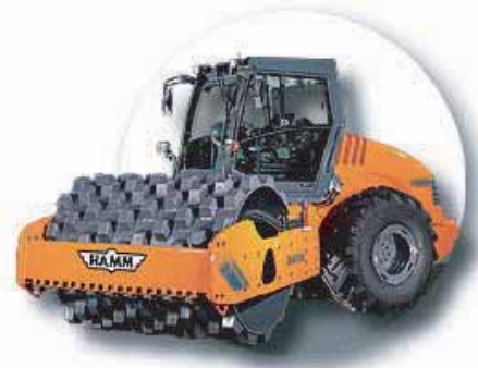
COMPACTEUR AVEC BILLE A PIEDS DAMEURS