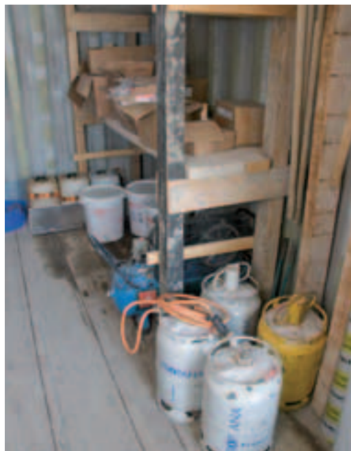
9 Pas de gaz en sous-sol!