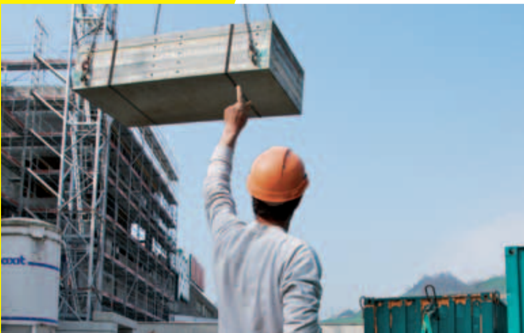
5 Le contremaître instruit le grutier.