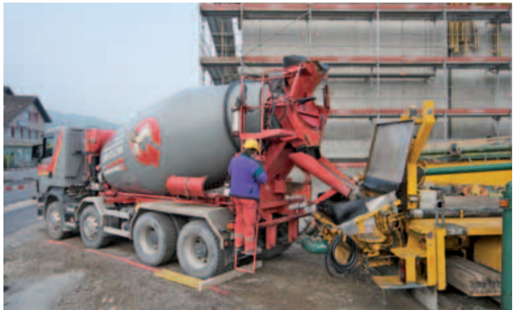
4 Livraison bien organisée.