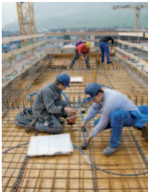
8 Pas de mise en danger mutuelle.