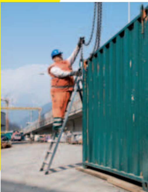
7 Voies d'accès sûres pour élingueurs.