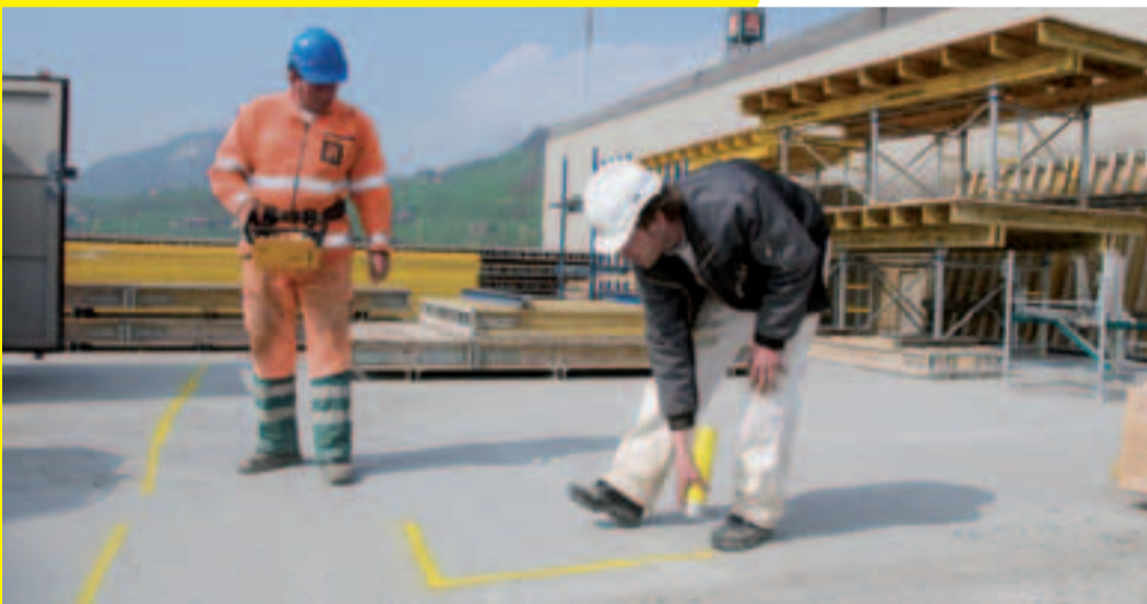
3 Concept de stockage clair.