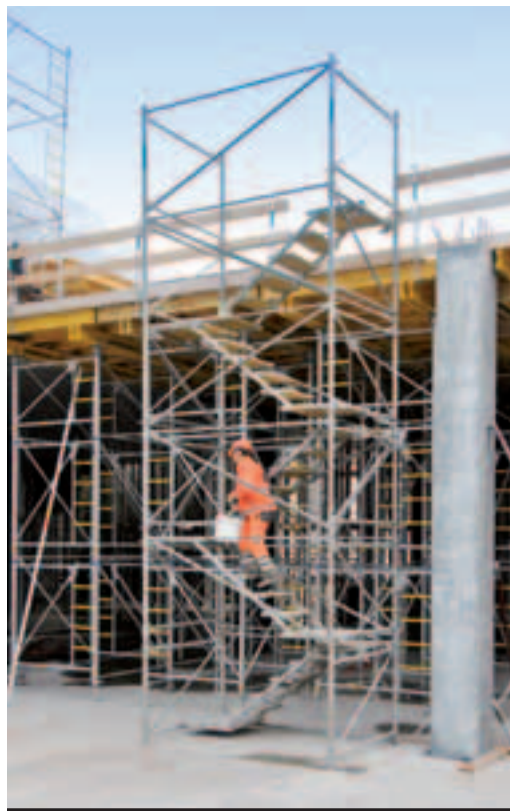
1 Accès sûrs pour personnes.

SBV Schweizerischer Baumeisterverband SSE Società Suisse des Entrepreneurs SSIC Società Svizzera degli Impresari-Costruttori Societad Svizra dals Impresaris-Constructurs