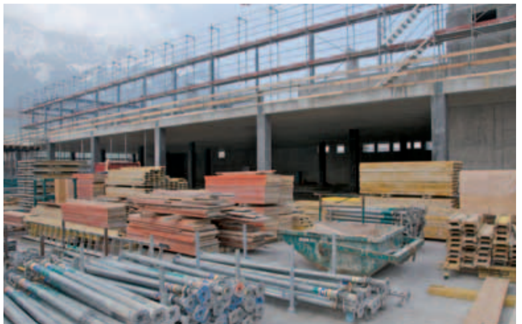
6 Empilage stable.