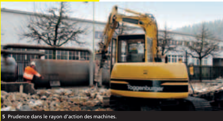
5 Prudence dans le rayon d'action des machines.