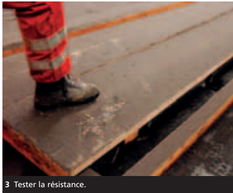
3 Tester la résistance.