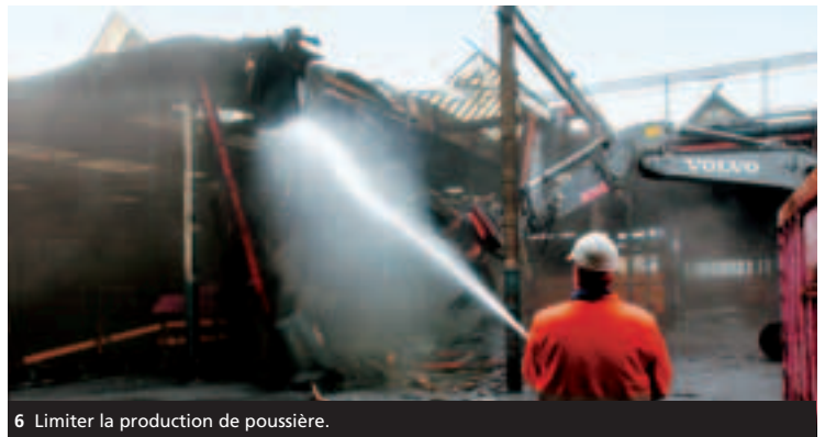
6 Limiter la production de poussière.