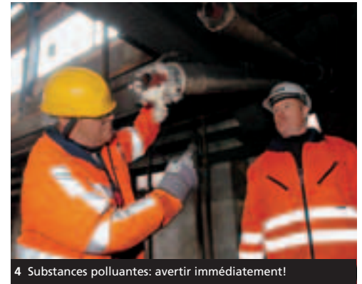
4 Substances polluantes: avertir immédiatement!