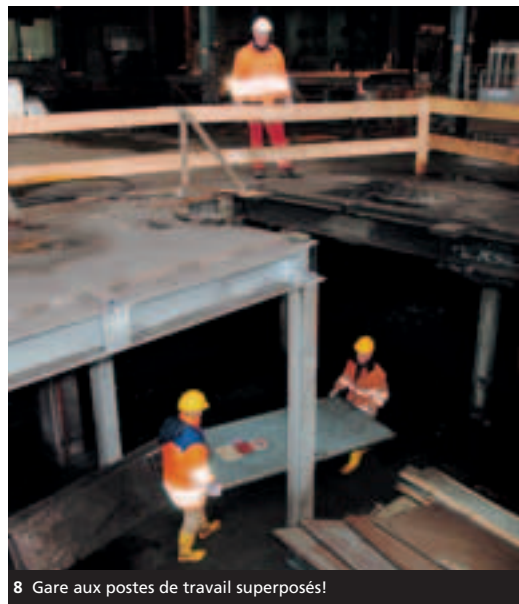
8 Gare aux postes de travail superposés!