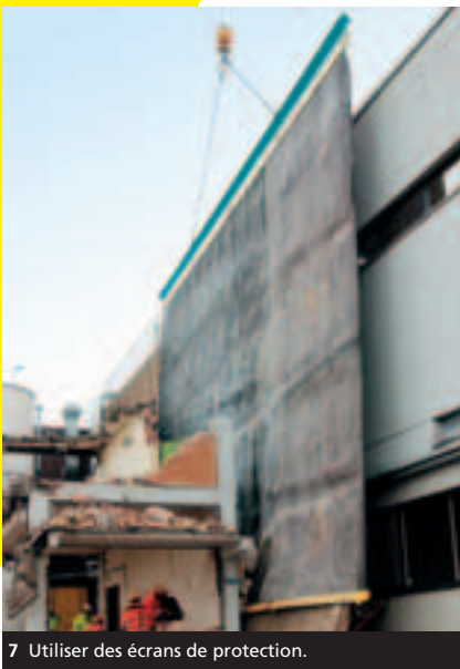
7 Utiliser des écrans de protection.