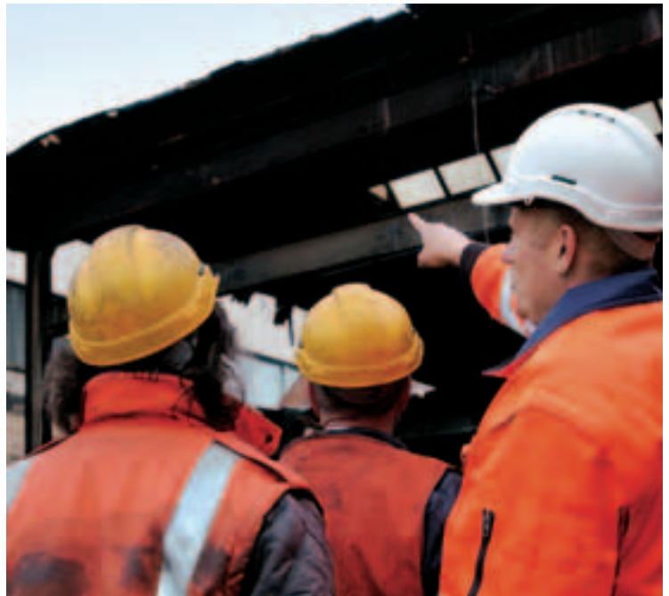
1 Une organisation claire.

SBV Schweizerischer Baumeisterverband SSE Società Suisse des Entrepreneurs SSIC Società Svizzera degli Impresari-Costruttori Societat Svizra dals Impresaris-Constructurs