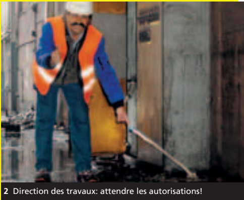
2 Direction des travaux: attendre les autorisations!