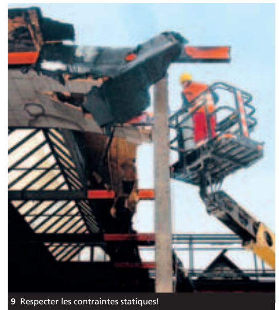
9 Respecter les contraintes statiques!