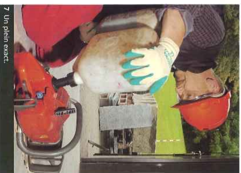
7 Un plein exact.