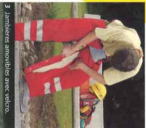
3 Jambières amovibles avec velcro.