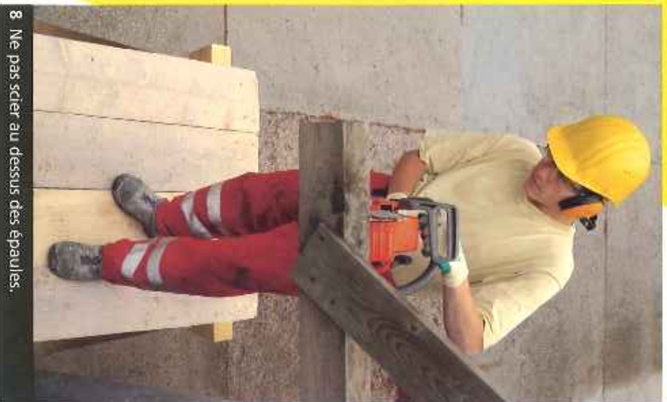
8 Ne pas scier au dessus des épaules.