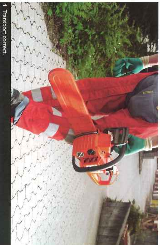
1 Transport correct.

Français – Ce journal paraît également en allemand, italien, espagnol, portugais et serbo-croate.