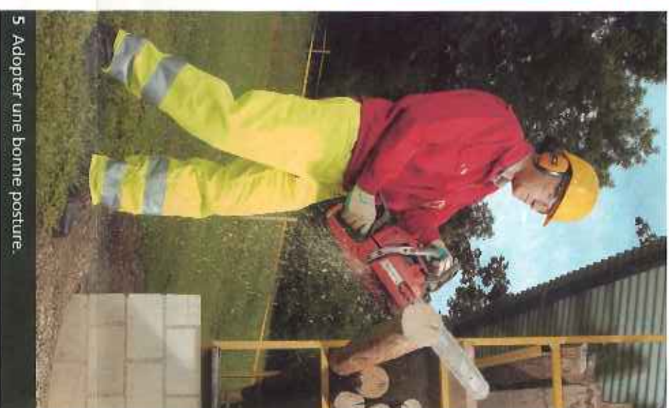
5 Adopter une bonne posture.