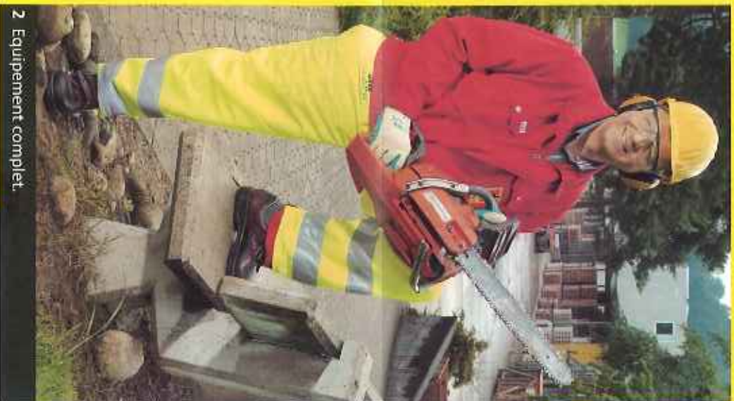
2 Equipement complet.

SBV Schweizerischer Baumeisterverband SSE Società Suisse des Entrepreneurs SSIC Società Svizzera degli Impresari-Constructori Societad Svizra dals Impresaris-Constructurs