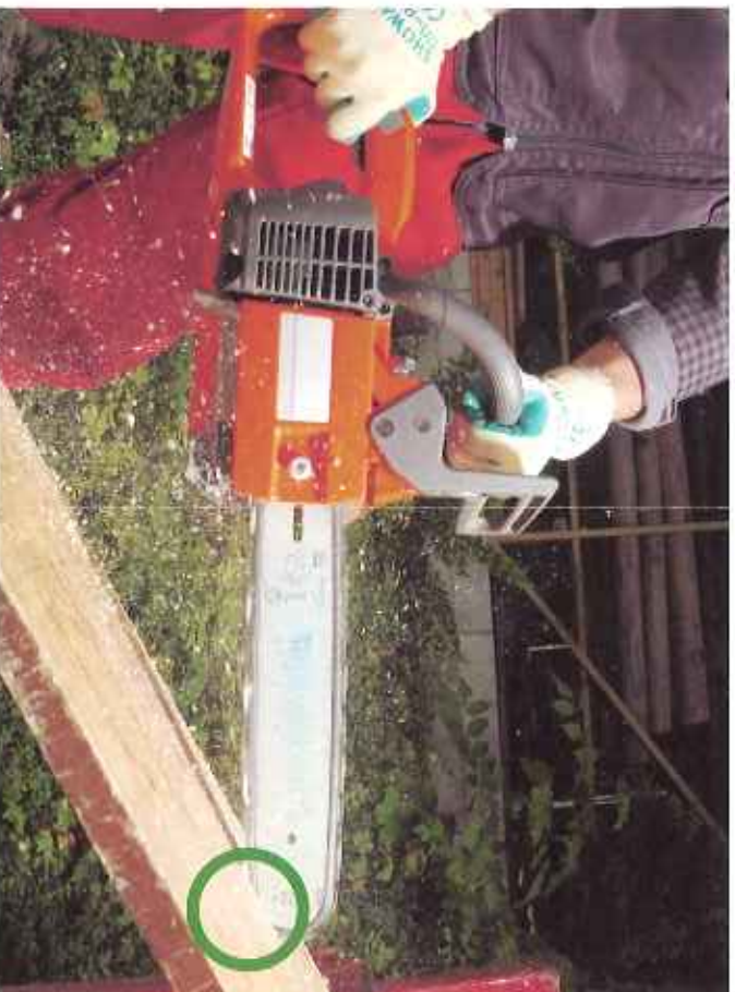
9 Découpe exact dans un panneau.