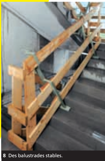
8 Des balustrades stables.