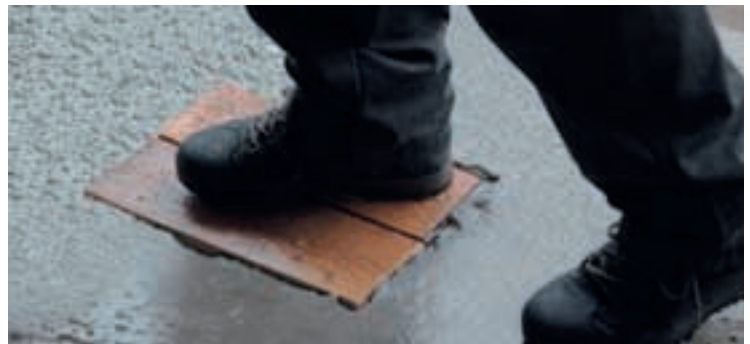
7 Les petites trémies sont aussi couvertes.