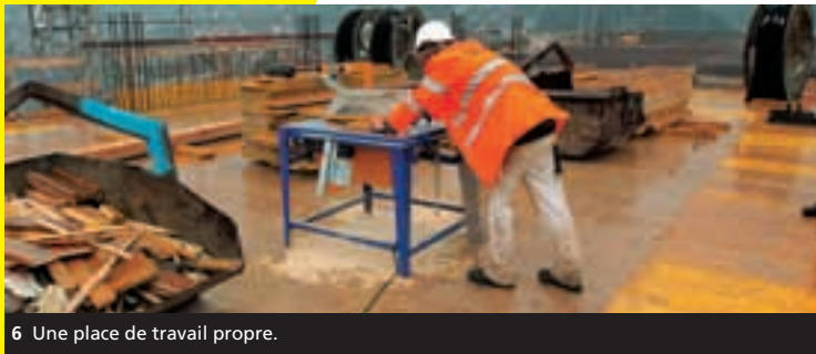
6 Une place de travail propre.