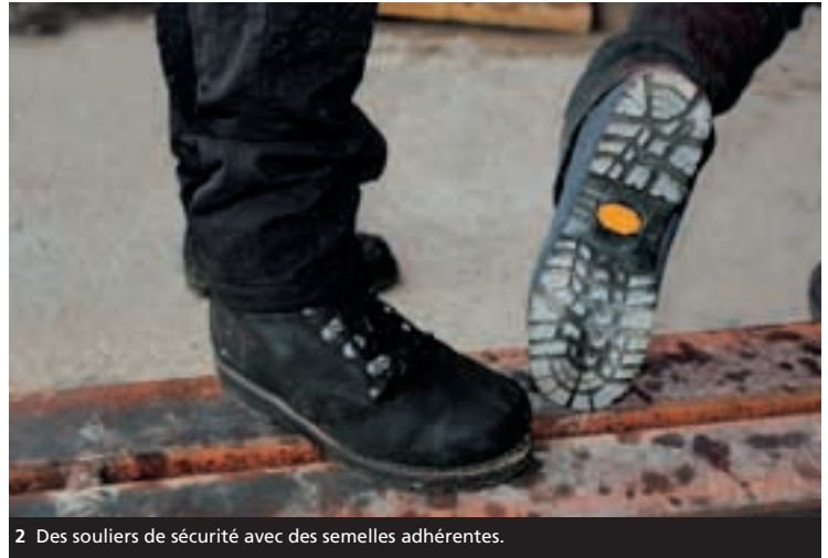
2 Des souliers de sécurité avec des semelles adhérentes.