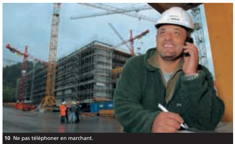
10 Ne pas téléphoner en marchant.