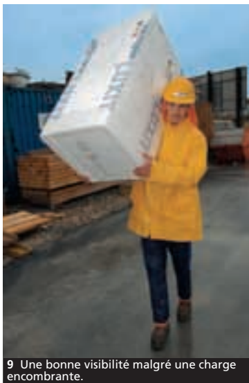
9 Une bonne visibilité malgré une charge encombrante.