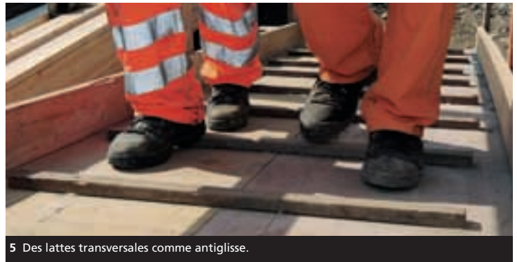
5 Des lattes transversales comme antiglisse.