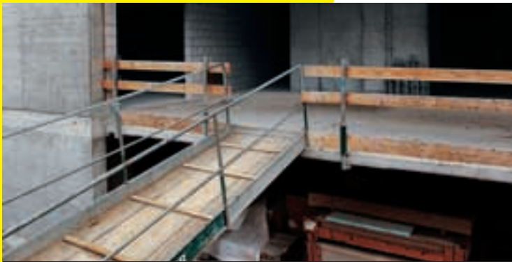
3 Des accès au chantier stables et sûrs.