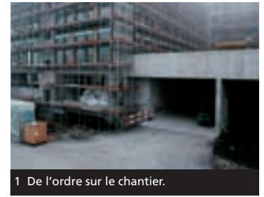
1 De l'ordre sur le chantier.