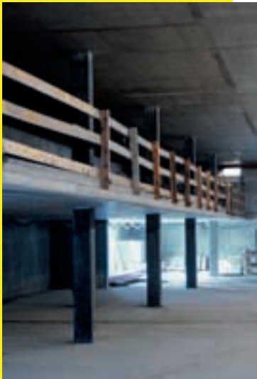
5 Des protections latérales contre les chutes.