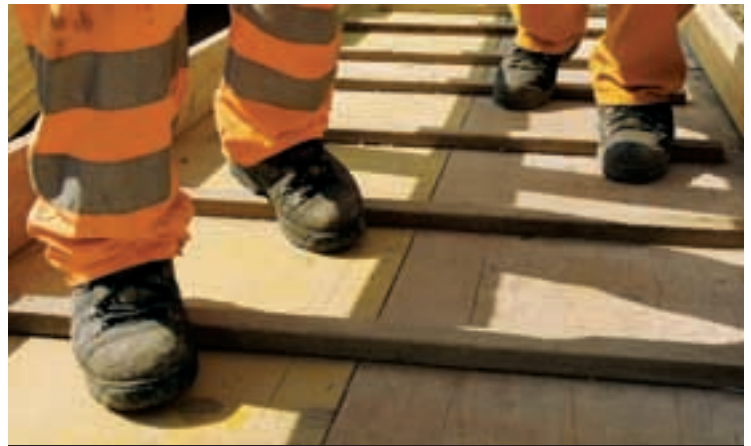
4 Des protections antiglisse sur les accès au chantier.