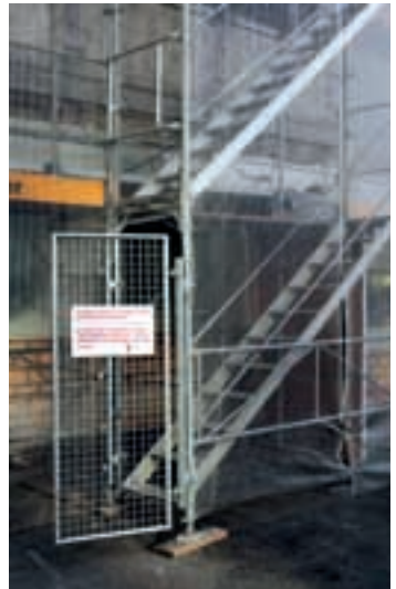
7 Des accès sûrs à l'échafaudage.