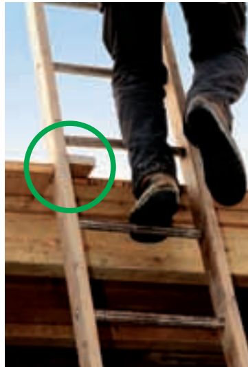
6 Des échelles assurées contre le glissement.