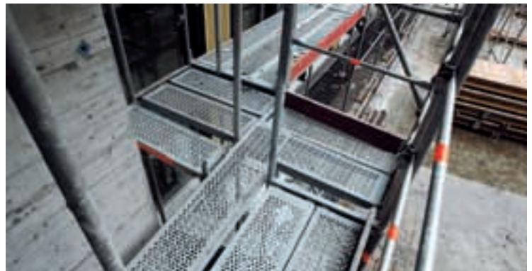
10 Des raccords de pont sans vide.