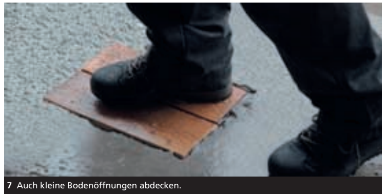
7 Auch kleine Bodenöffnungen abdecken.