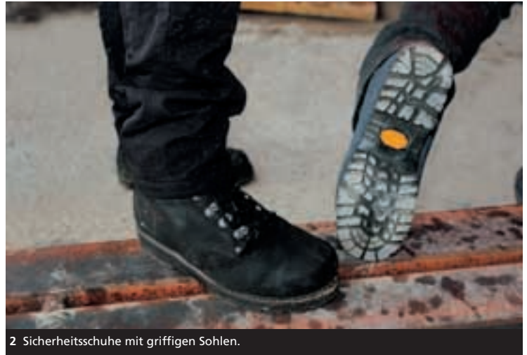
2 Sicherheitsschuhe mit griffigen Sohlen.