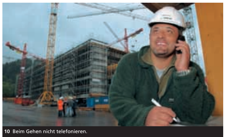
10 Beim Gehen nicht telefonieren.