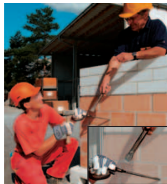
Keine improvisierten Werkzeuge.