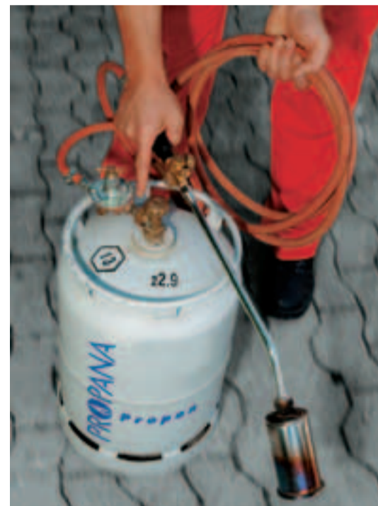
Sind Schläuche und Ventil dicht?