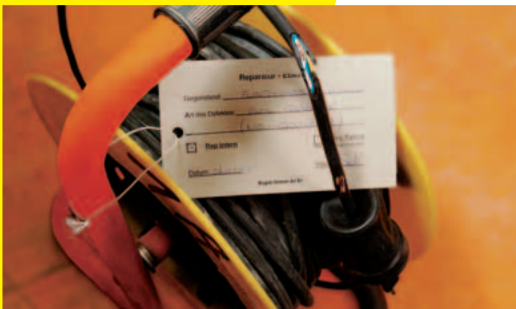
Sofort in Reparatur geben.