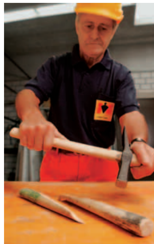
Defekte Werkzeugstiele ersetzen.