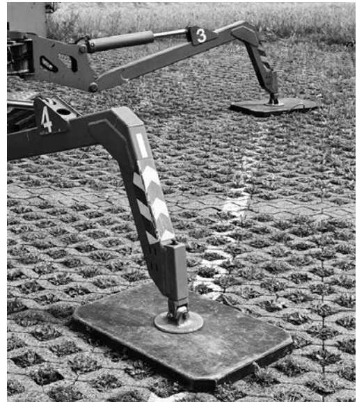
Bild 2: Hubarbeitsbühnen mit Stützen müssen auf unbefestigten Böden auf Unterlegplatten abgestützt werden.