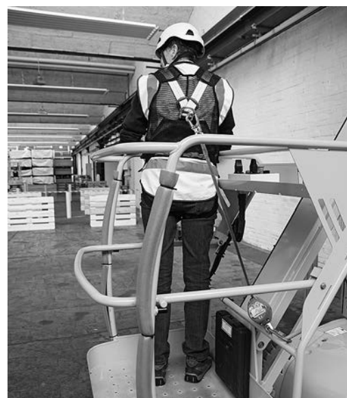
Bild 5: Achtung: Beim Verwenden des Rückhaltesystems nur die zugelassenen Anschlagpunkte benutzen und Verbindungsmittel möglichst kurz halten (Betriebsanleitung beachten).

Bei älteren Bühnen ohne entsprechende Anschlagpunkte: Verbindungsmittel mit einer Bandschlinge an einem tragfähigen Bauteil im unteren Bereich des Arbeitskorbes anschlagen. Im Zweifelsfall Fachperson (z. B. Bühnenlieferant) beiziehen