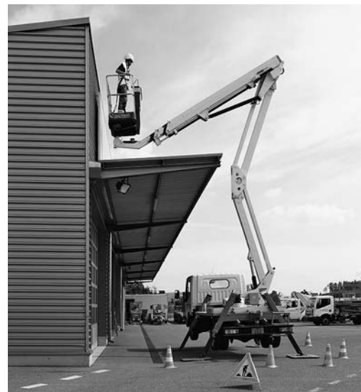
Bild 4: Der Arbeitsplatz ist so abzusichern, dass Passanten nicht in den Gefahrenbereich der Hubarbeitsbühne treten.