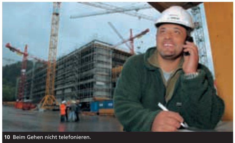
10 Beim Gehen nicht telefonieren.