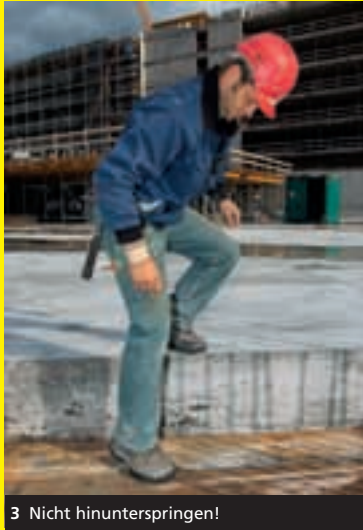
3 Nicht hinunterspringen!