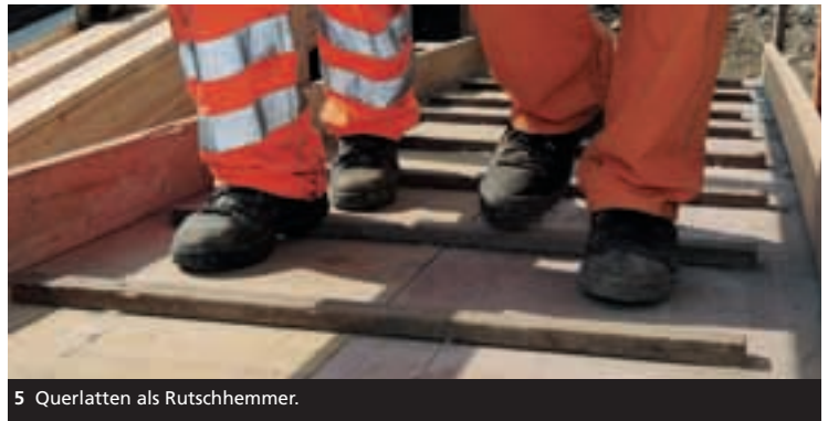
5 Querlatten als Rutschhemmer.