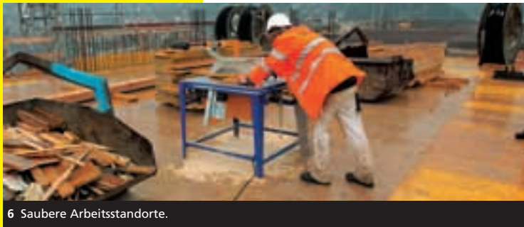
6 Saubere Arbeitsstandorte.