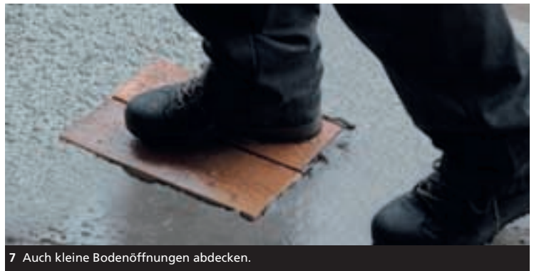
7 Auch kleine Bodenöffnungen abdecken.