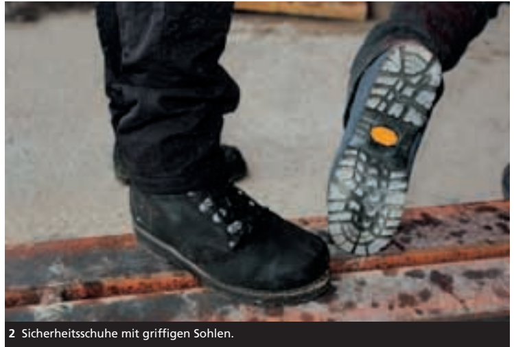
2 Sicherheitsschuhe mit griffigen Sohlen.

SBV Schweizerischer Baumeisterverband SSE Société Suisse des Entrepreneurs SSIC Società Svizzera degli Impresari-Costruttori Societad Svizra dals Impresaris-Constructurs