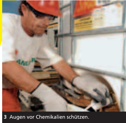
3 Augen vor Chemikalien schützen.