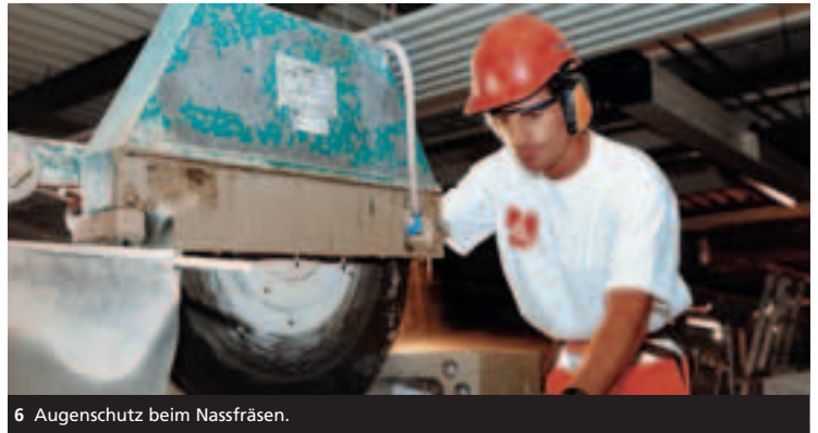
6 Augenschutz beim Nassfräsen.