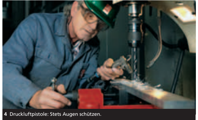
4 Druckluftpistole: Stets Augen schützen.