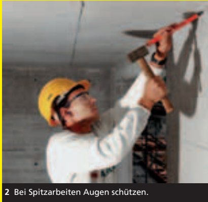
2 Bei Spitzarbeiten Augen schützen.