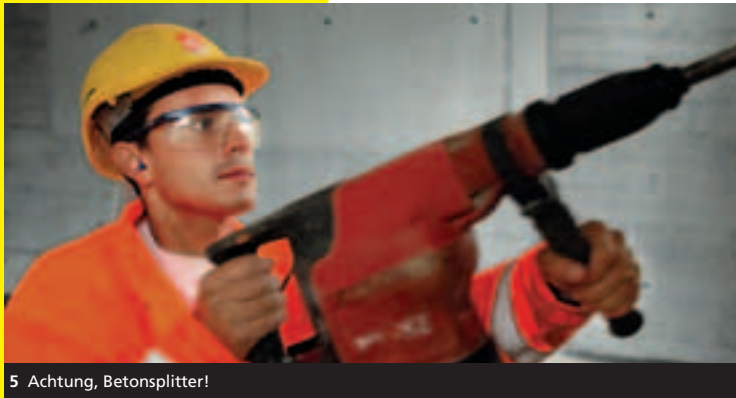
5 Achtung, Betonsplitter!