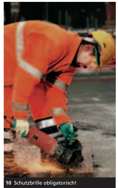
10 Schutzbrille obligatorisch!