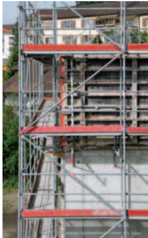
8 Fassadenabstand \leq 30 cm.