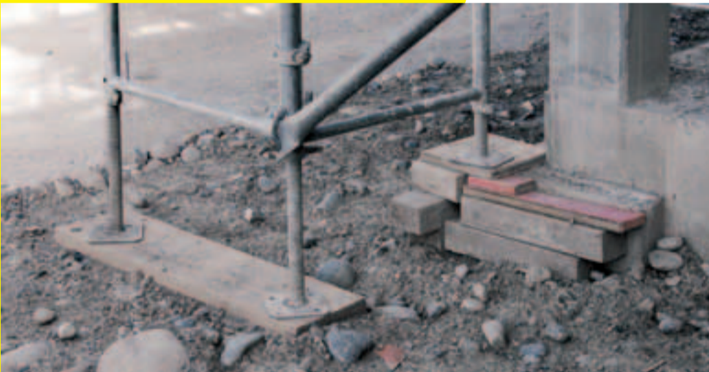
2 Solide Gerüstfundation.