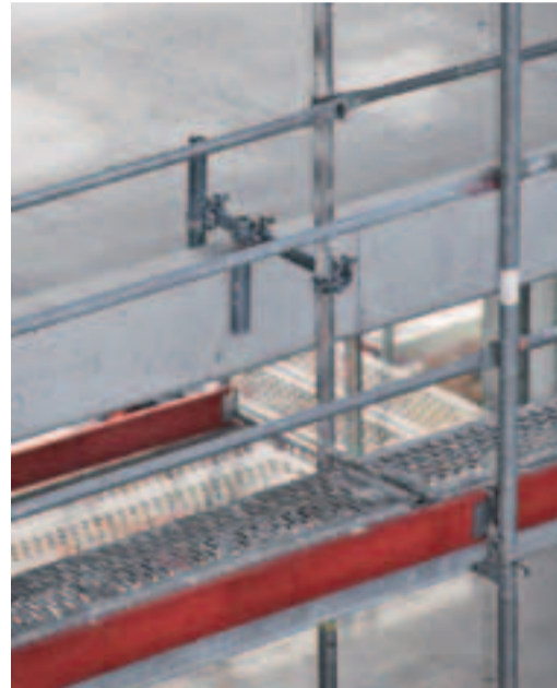
3 Stabile Gerüstverankerung.