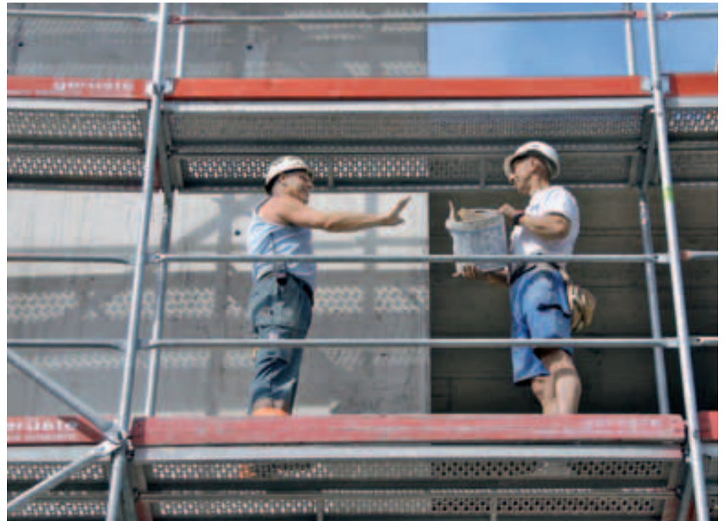
9 Halt, nicht hinunterwerfen!