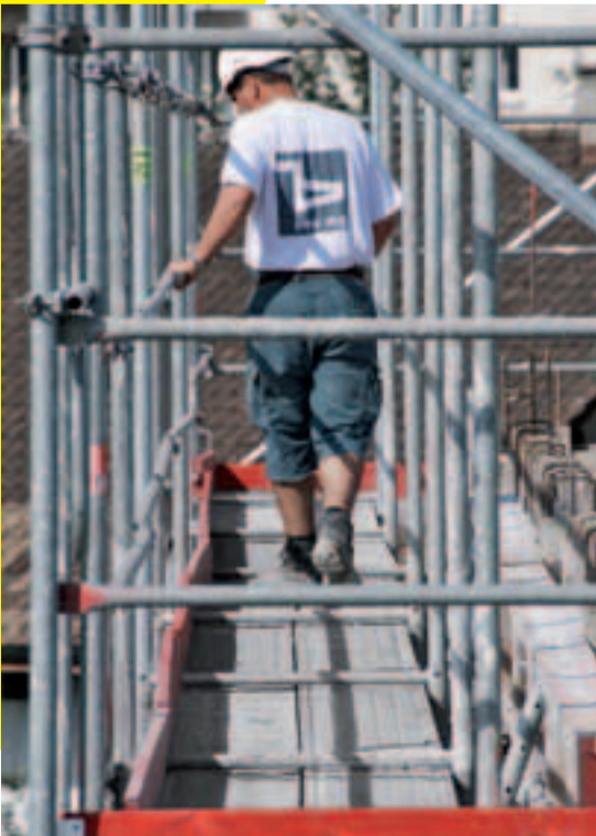
7 Gerüstbeläge freihalten.