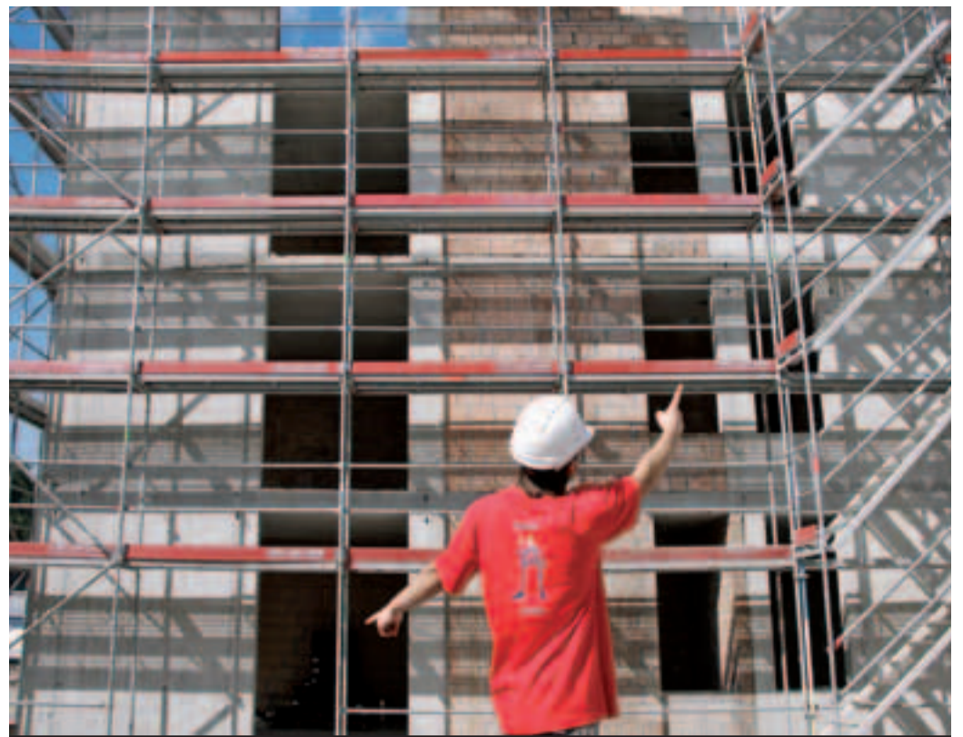
1 Sicherheitscheck vor dem Aufstieg.

SBV Schweizerischer Baumeisterverband SSE Société Suisse des Entrepreneurs SSIC Società Svizzera degli Impresari-Costruttori Societad Svizra dals Impresaris-Constructurs