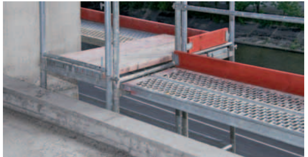
6 Sichere Ecken und Übergänge.