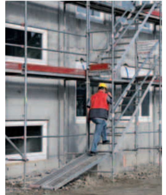
4 Sichere Gerüstaufgänge.