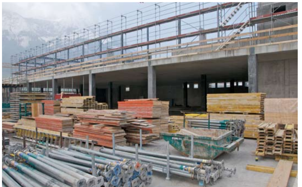
6 Standfest aufgeschichtet.