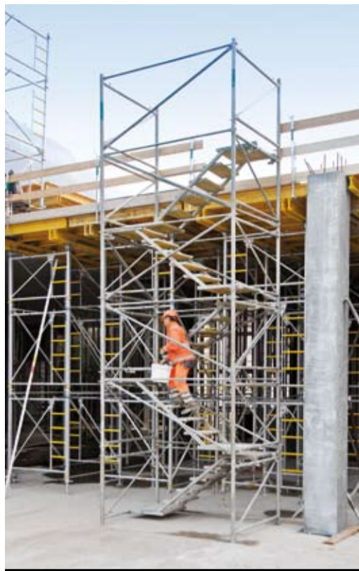
1 Aufstieg für Personen.

SBV Schweizerischer Baumeisterverband SSE Société Suisse des Entrepreneurs SSIC Società Svizzera degli Impresari-Costruttori Societad Svizra dals Impresaris-Constructurs