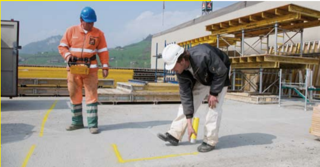
3 Klares Lagerkonzept.