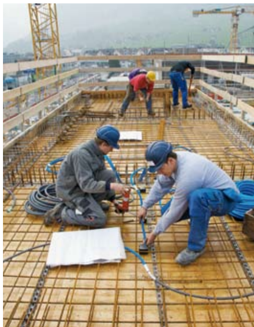
8 Keine gegenseitigen Gefährdungen.