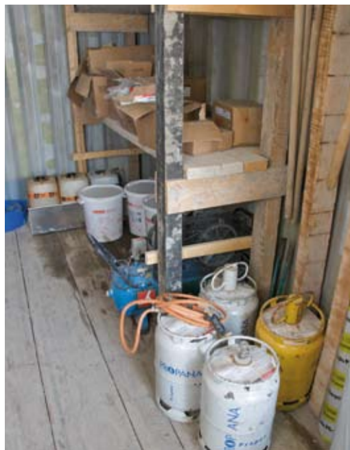
9 Gasflaschen nie im Keller lagern!