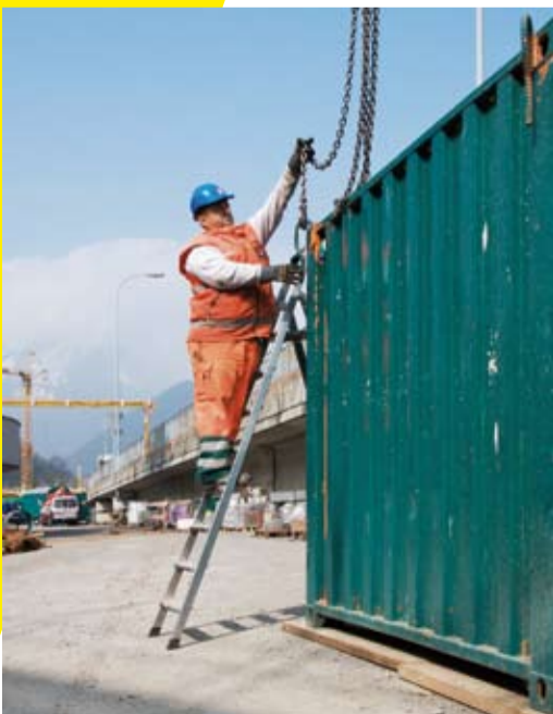
7 Sichere Aufstiegshilfe für Anschläger.