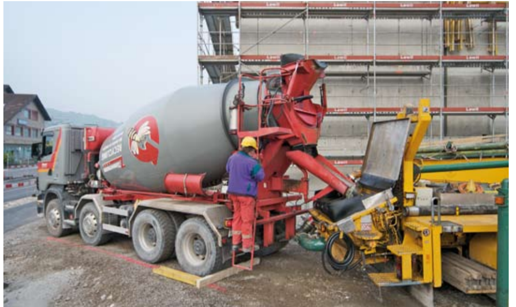
4 Geordnete Materialanlieferung.