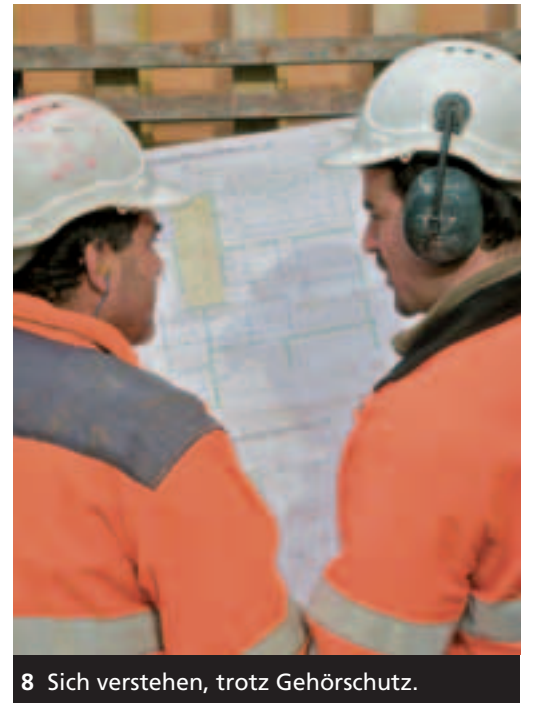
8 Sich verstehen, trotz Gehörschutz.