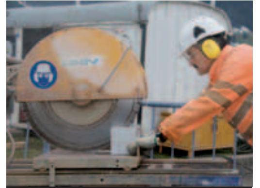
2 Gehörschutz mit Pfropfen oder Kapseln.