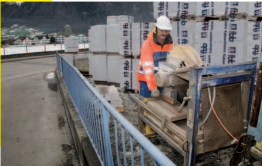
9 Sicherer Standort für laute Arbeitsplätze.