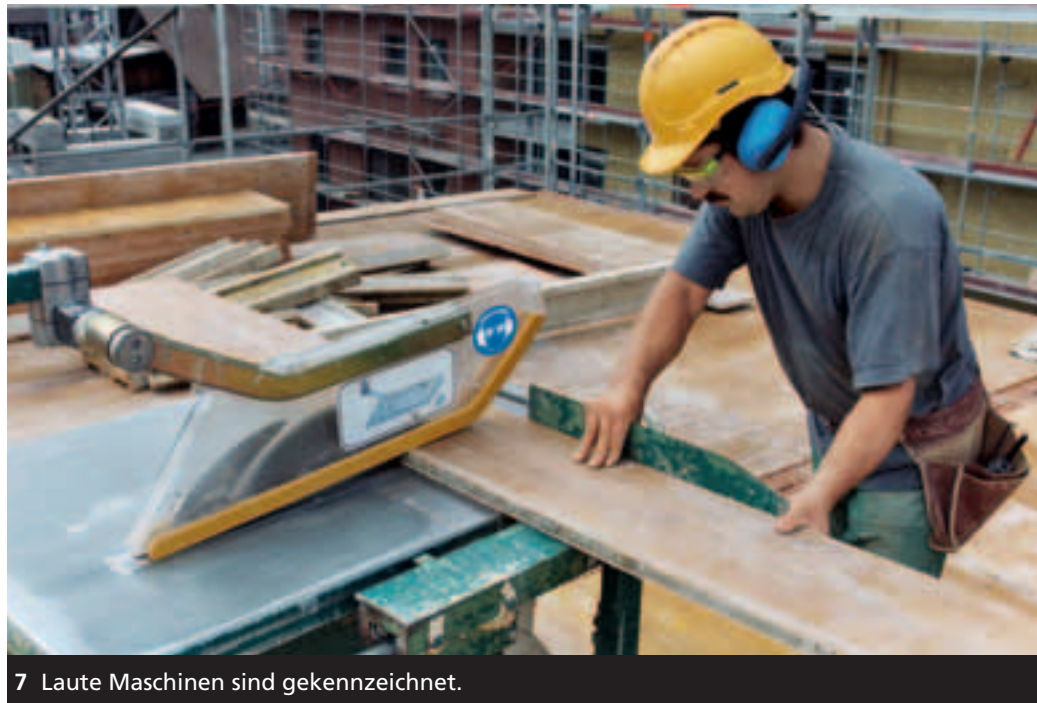
7 Laute Maschinen sind gekennzeichnet.