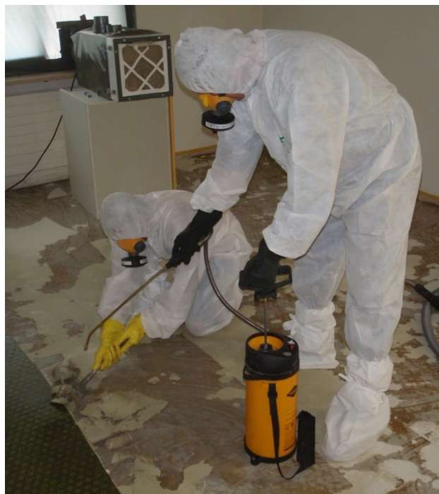
5 So wird der Belag entfernt.