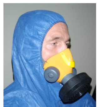
4 Halbmaske mit Partikelfilter