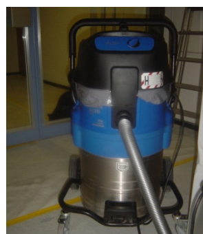
3 Industriestaubsauger mit Filter für Staubklasse H (Asbest)