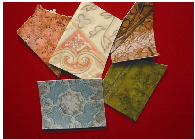
2 Mehrschichtige Bodenbeläge bestehen in der Regel aus PVC mit einer Trägerschicht aus schwachgebundenem Asbest.