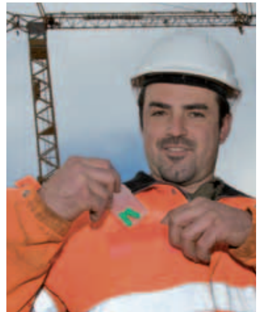
5 Toujours les avoir sur soi!