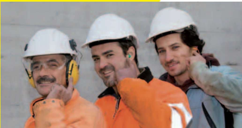
3 Le confort dépend du bon choix!