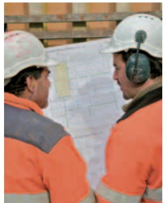
8 Se comprendre, malgré le bruit.