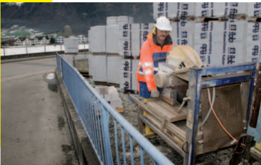
9 Des places sûres pour les travaux bruyants.