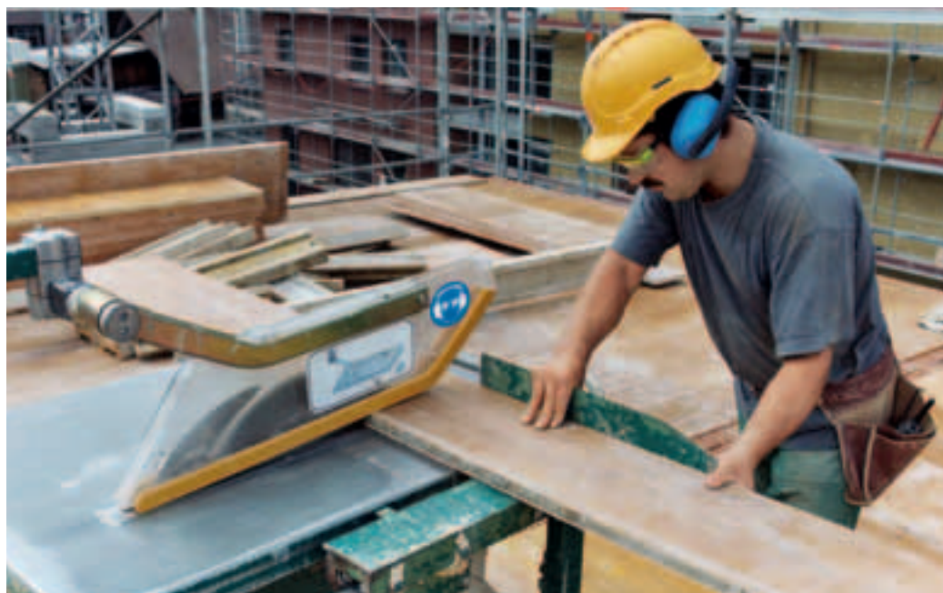
7 Signaler les machines bruyantes.