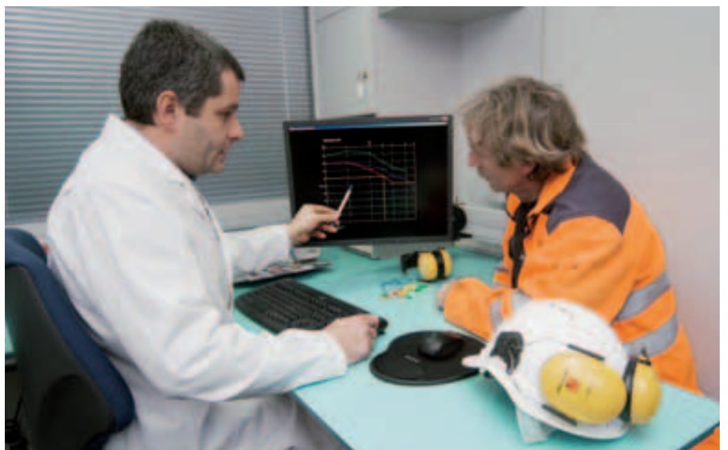
10 Contrôle périodique de l'ouïe dans l'audiomobile de la Suva.