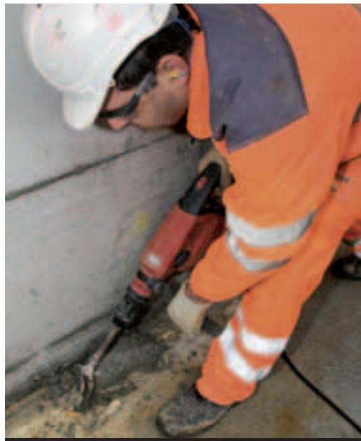
4 Les tampons sont agréables quand il fait chaud.