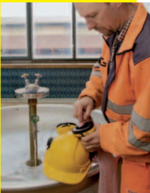
6 Entretien et nettoyer régulièrement.