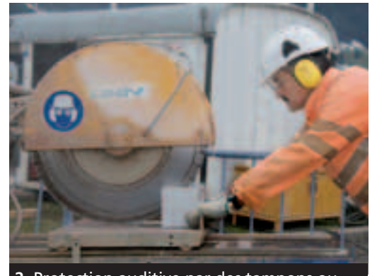
2 Protection auditive par des tampons ou des coquilles.