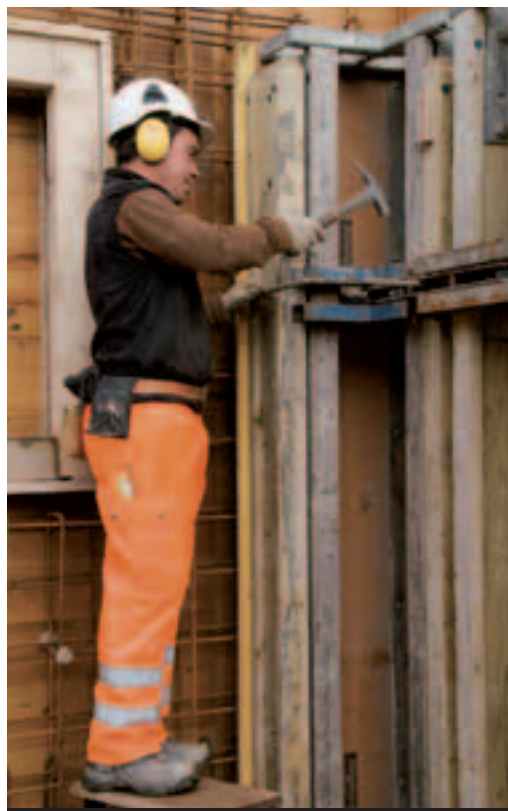
1 Protège ton ouïe!

SBV Schweizerischer Baumeisterverband SSE Società Suisse des Entrepreneurs SSIC Società Svizzera degli Impresari-Costruttori Societat Svizra dals Impresaris-Constructurs