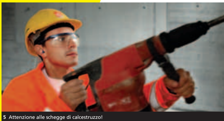
5 Attenzione alle schegge di calcestruzzo!