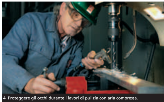
4 Proteggere gli occhi durante i lavori di pulizia con aria compressa.