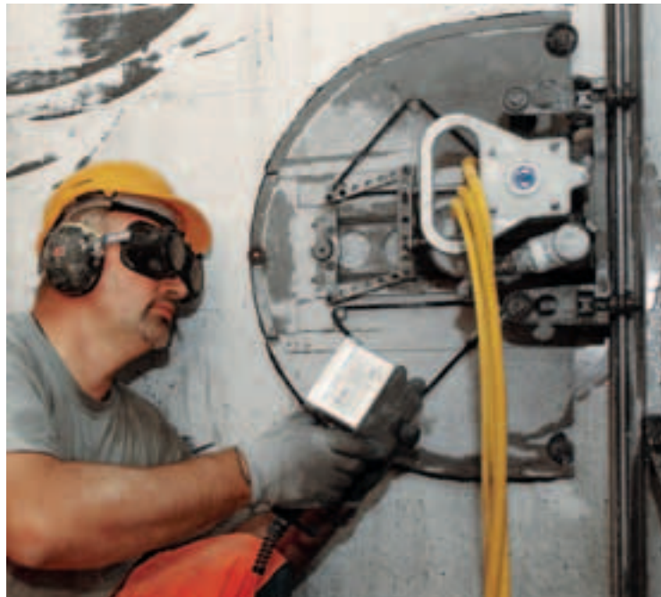
1 Sicurezza durante il taglio del calcestruzzo.

SBV Schweizerischer Baumeisterverband SSE Société Suisse des Entrepreneurs SSIC Società Svizzera degli Impresari-Costruttori Societat Svizra dals Impresaris-Constructurs