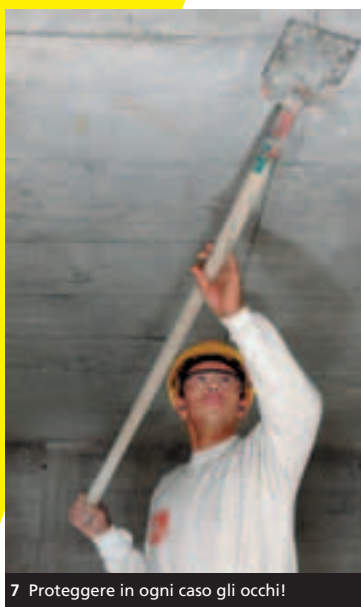
7 Proteggere in ogni caso gli occhi!