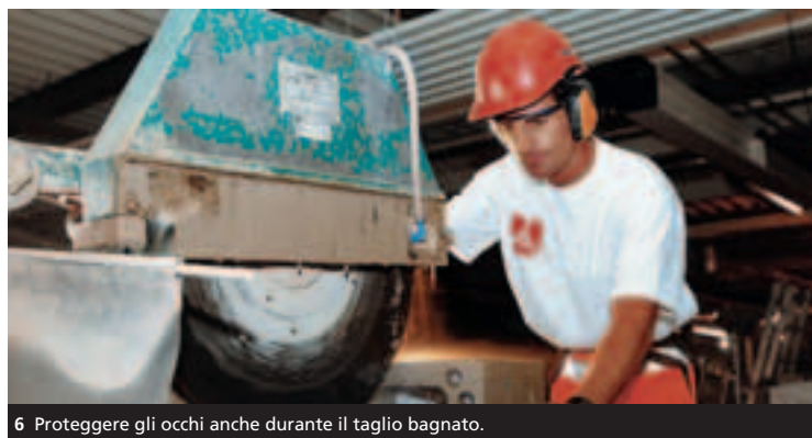
6 Proteggere gli occhi anche durante il taglio bagnato.