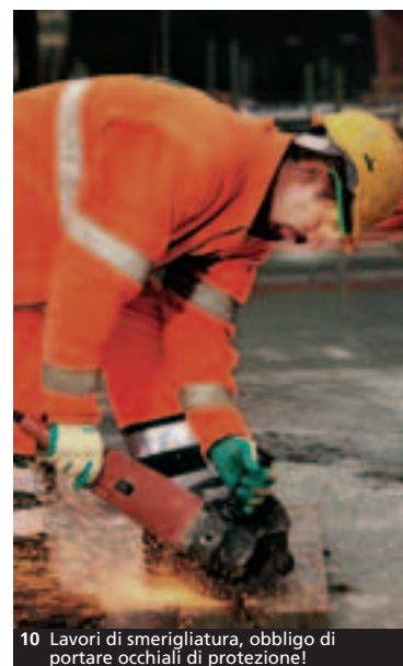
10 Lavori di smerigliatura, obbligo di portare occhiali di protezione!