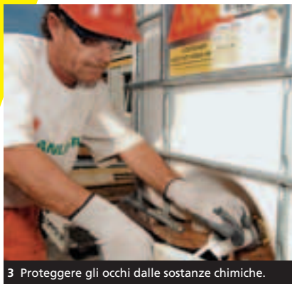
3 Proteggere gli occhi dalle sostanze chimiche.