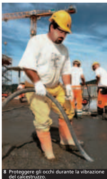
8 Proteggere gli occhi durante la vibrazione del calcestruzzo.