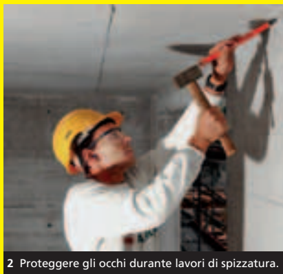
2 Proteggere gli occhi durante lavori di spizzatura.